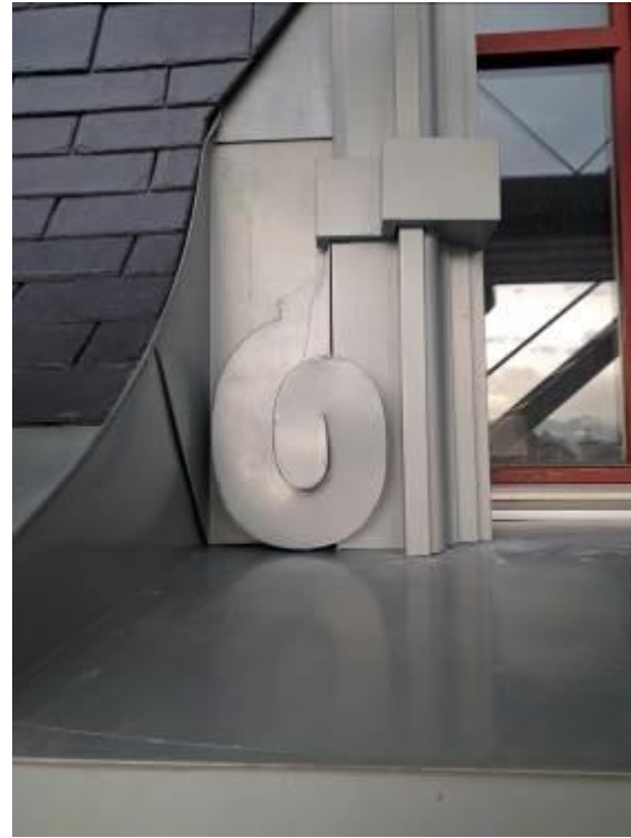
Bild 11, Bild 12 und Bild 13: Alle Formteile und Schnecken sowie Leibungen wurden in der eigenen Werkstatt produziert, dann am Bau montiert.