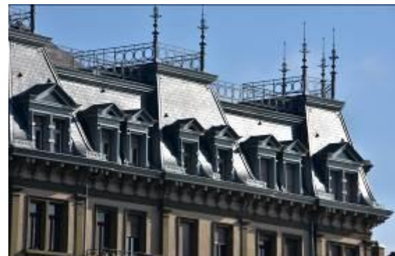
Bild 1 und Bild 2: Sanierung unter Denkmalschutz: Im Mansardendachbereich entspricht kein Bauteil dem Standard. Alle Bauteile aus Titanzink wurden individuell gefertigt.