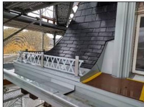
Bild 3, Bild 4 und Bild 5: Dachrand und Anschluss über die Rinne, oben eigens entwickelten Halterungen und Schneefang Kreuzstege.