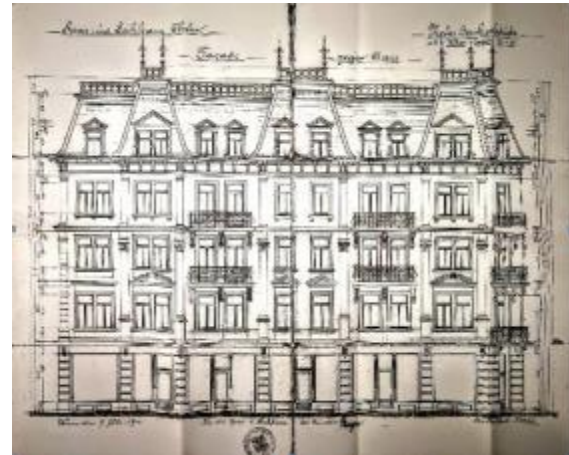
Bild 6 und Bild 7: Das stolze Gebäude vor der Renovation und die Pläne vom vorderen Jahrhundert.

Adlatus AG Real Estate Partners, 2502 Biel