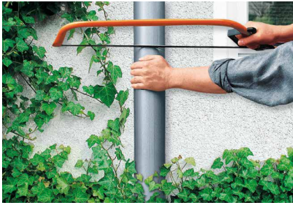
Découpe d'un morceau de tuyau de 30 cm environ