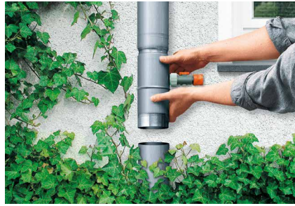
Mise en place simple et ajustée du Récupérateur pour tuyau de descente RHEINZINK